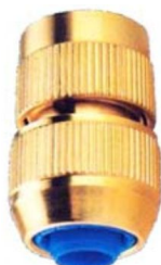
KUPPLUNGSTEIL mit Verschraubung für 1/2" u. 3/4" Schl.