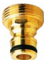
STECKTEIL mit Außengewinden