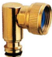
WINKELSTECKTEIL mit Außengewinde