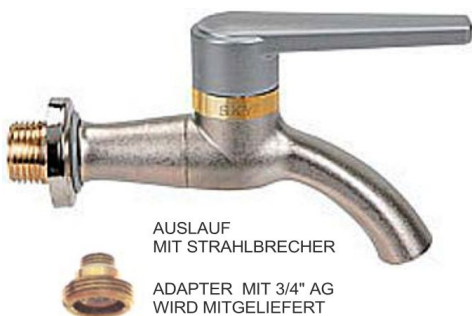
AUSLAUF MIT STRALBRECHER