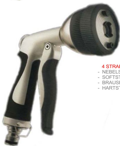
4 STRAHLARTEN - NEBELSTRAHL - SOFTSTRAHL - BRAUSESTRAHL - HARTSTRAHL