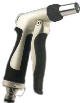
DÜSE Stufenlos verstellbar