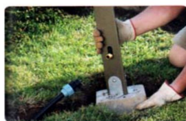
Befestigungs-Set für Verankerung im Rasen