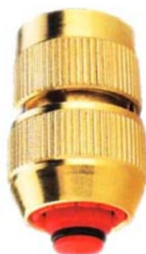
KUPPLUNGSTEIL mit Verschraubung für 1/2" u. 3/4" Schl.