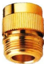
KUPPLUNGSTEIL mit 3/4" Außengew.