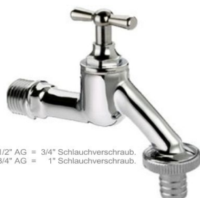
1/2" AG = 3/4" Schlauchverschraub. 3/4" AG = 1" Schlauchverschraub.