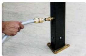
Befestigung für Verankerung am Boden

mit Befestigung für Verankerung am Rasen