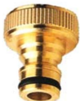
STECKTEIL mit Innengewinden